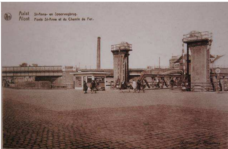
Het Werfplein met de Sint-Annabrug. Vroeger werd de brug vooral gebruikt door voetgangers, nu staat er een lange rij auto's. - Rutger Lievens