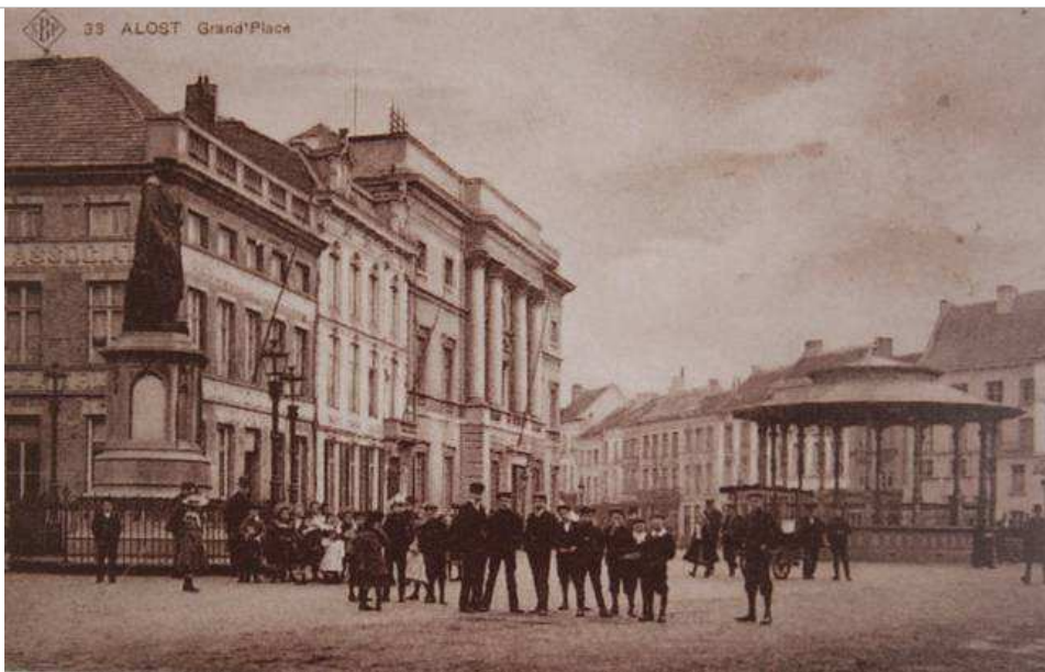
De Grote Markt, vroeger en nu. De gebouwen links en het standbeeld staan er nog altijd. De kiosk is wel verdwenen. - Rutger Lievens